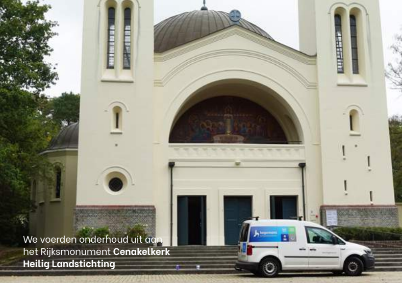
We voerden onderhoud uit aan het Rijksmonument Cenakelkerk Heilig Landstichting